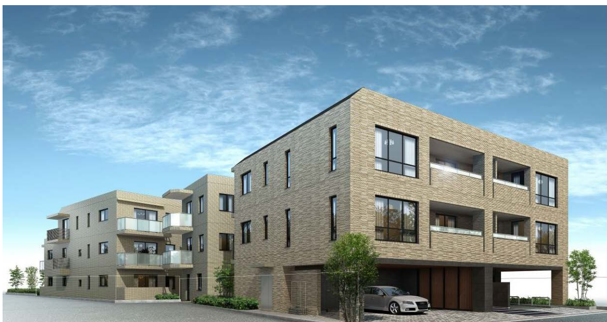
【外観完成予想図】 計画段階の図面を基に描き起こしたもので実際とは多少異なります。